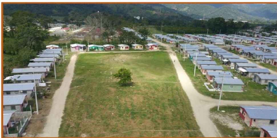
VIVIENDAS ENTRE 1era Ave "A" y 1era Ave.