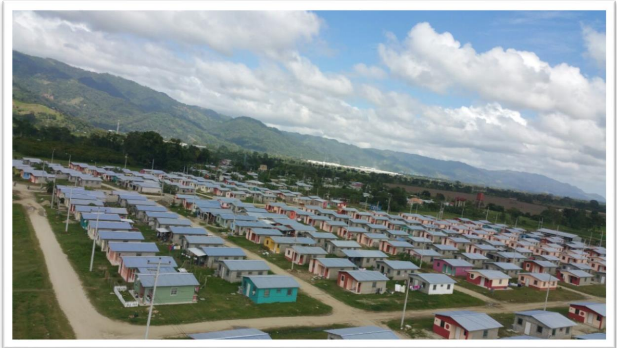
VIVIENDAS Entre 2da Y 3era Calle – 1era Y 7ma Avenida